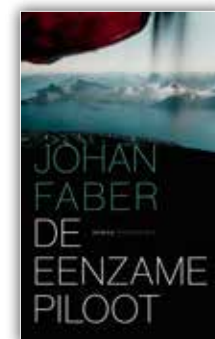
De eenzame piloot