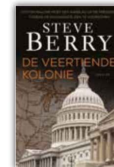
De veertiende kolonie

Houdt u van historische romans? De boomgaard neemt u mee naar het Amerika van de jaren dertig. Het is crisis, de tijd van de Grote Depressie. De jonge Eliza Wyatt staat voor de onmogelijke taak om in haar eentje de fruitkwekerij van de familie voort te zetten. Ze heeft drie kinderen, een merkwaardige tante en veel schulden. Hulp krijgt ze op een onverwachte dag van een vreemdeling. Maar het is net alsof hij een geheim met zich meedraagt, een geheim dat in de loop van het verhaal op een meesterlijke manier wordt ontrafeld. De Boomgaard is een boek geschreven in de christelijke traditie, dat inmiddels in Amerika is verfilmd.